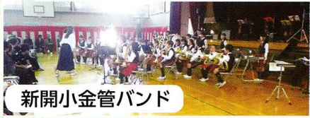
新開小金管バンド