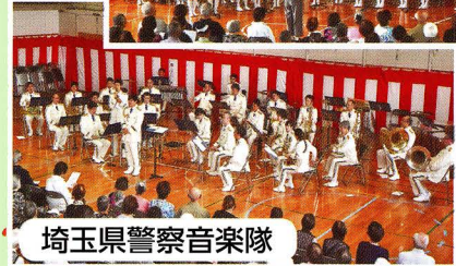
埼玉県警察音楽隊