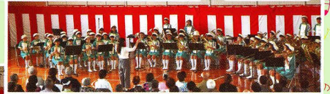
土合小 金管バンド