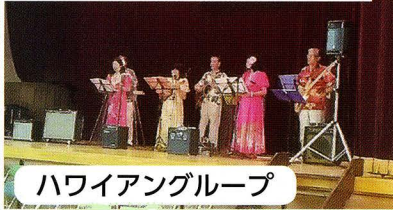
ハワイアングループ

第一支部は、10月6日に土合小と新開小の2つの会場で高齢者の方々をお招きして敬老のつどいを開催しました。 10月にしては暑い日となりましたが、両会場合わせて約750名の方がご参加ください、どちらの会場も大盛況でした。 第三支部の敬老会はお祝品のお届け配布となりました。